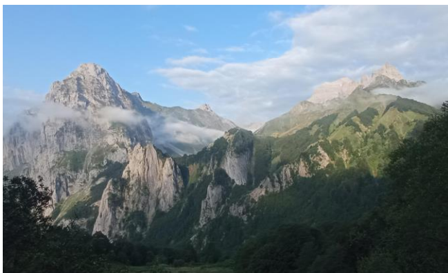
Prieuré Notre-Dame de Sarrance (64)

(en météo très mauvaise, « cheminer » pourra s'adapter, mais ... ne pas craindre de se mouiller une fois ou l'autre !)